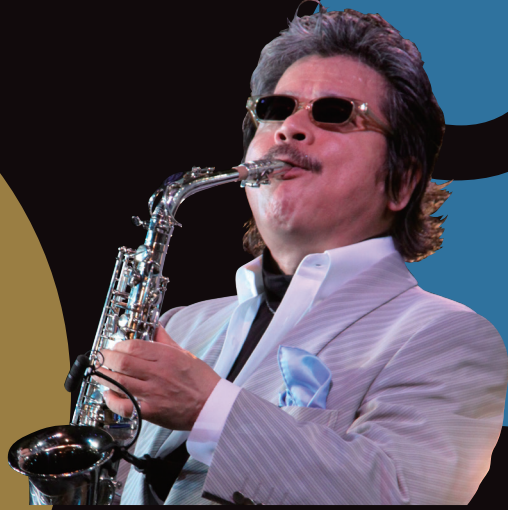
MALTA Saxophone / Conductor