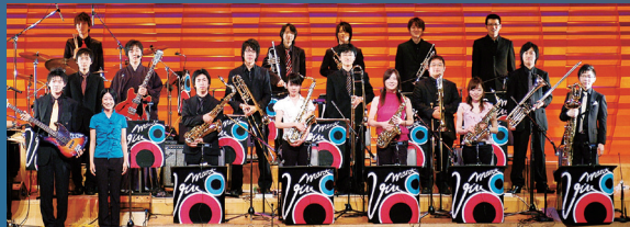
MANTO VIVO 東京藝術大学ビッグバンド

チケットぴあ TEL. 0570-02-9999 http://t.pia.jp (Pコード:199-045) (一部携帯電話・PHS・IP電話はご利用いただくことができません) 東京文化会館チケットサービス TEL. 03-5685-0650 http://www.t-bunka.jp/ticket イープラス(e+) http://eplus.jp ヴォートル・チケットセンター TEL. 03-5355-1280 http://ticket.votre.co.jp 藝大アートプラザ TEL. 050-5525-2102