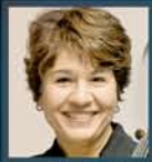
ミハエラ・マルティン (ヴァイオリン)

ルーマニア出身のヴァイオリン奏者。父、G.エネスクとS.ゲオルギュに学ぶ。19歳でチャイコフスキー国際コンクール第2位、モントリオール、シオン、ブリュッセルの各コンクールでは最高位、1982年インディアナポリス国際ヴァイオリン・コンクール第1位。ロイヤル・フィルハーモニー管弦楽団、ゲヴァントハウス管弦楽団やM.アルゲリッチ、Y.バシュメット、L.フライシャーらと共演を重ねる。現在、ジュネーヴ音楽大学教授。