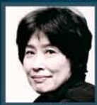
今井 信子 (ヴィオラ)

桐朋学園大学卒業後、イェール大学、ジュリアード音楽院を経て、1967年ミュンヘン国際音楽コンクール、68年ジュネーヴ国際音楽コンクール最高位入賞。70年西ドイツ音楽功労賞受賞。ベルリン・フィルハーモニー管弦楽団をはじめ世界で活躍。日本では「ヴィオラ・スペース」などの企画・演奏。93年文化庁芸術選奨文部大臣賞、94年京都音楽賞、95年モービル音楽賞、96年毎日芸術賞とサントリー音楽賞。現在、ジュネーヴ音楽大学教授。