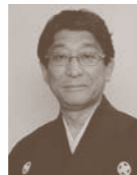
メドゥーサ男爵 清水寛二