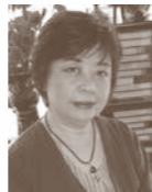
アルキピアデス 小林真理