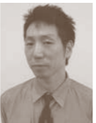
召使いポリカルプ 重盛次郎