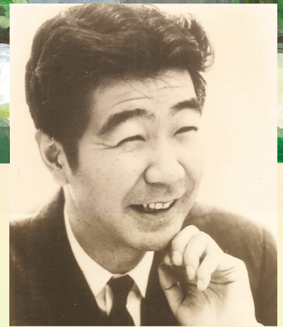
矢代秋雄(1929~1976) 没後40周年記念

* 藝大学生オーケストラは「東京藝大シンフォニーオーケストラ」に名称を変更いたしました。