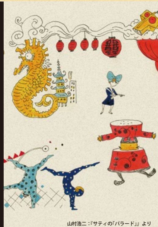
山村浩二：『サティの「バラード」』より