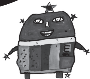
藝大とあそぼう キャラクター エラメルくん