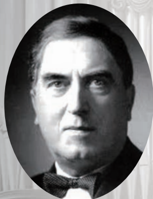
モーリス・デュリュフレ (仏 1902-1986)