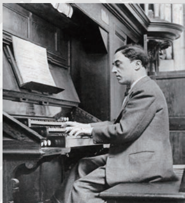
サンティエヌヌ・デュ・モン教会でオルガンを弾くデュリュフレ

《レクイエム》で有名な孤高の作曲家モーリス・デュリュフレ Maurice Durufle(1902-1986)が亡くなって今年で30年となりました。パリ国立高等音楽舞踊院の作曲科教授だったデュリュフレは、自分自身に非常に厳しい“完璧主義者”だったため、後世に残した作品はたったの16曲。そのうちの7曲がオルガン作品です。